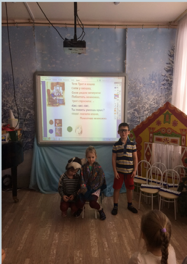
«Тетя Трот и кошка»