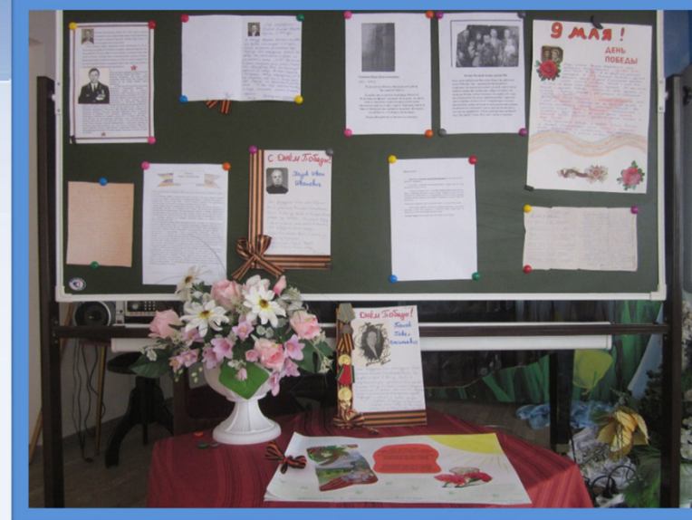
Акция «Бессмертный полк»