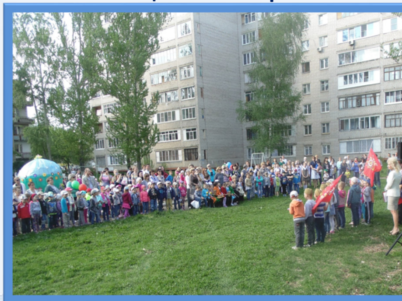
Проект «Великая Победа» для жителей микрорайона